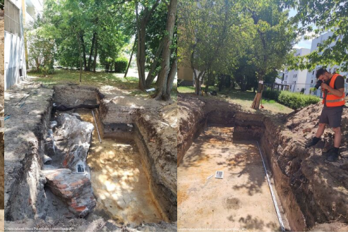
Prace poszukiwawcze w Warszawie