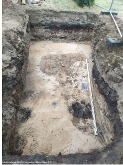
Prace poszukiwawcze w Warszawie