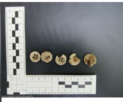
Prace poszukiwawcze w Krakowie