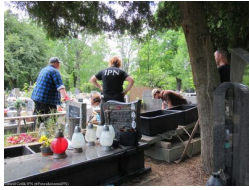
Prace poszukiwawcze w Krakowie