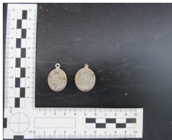
Prace poszukiwawcze w Krakowie