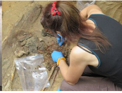
Prace poszukiwawcze w Krakowie