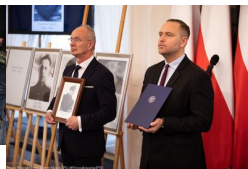
Podsumowanie prac BPil 2023 r.