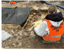
Podsumowanie prac BPil 2023 r.