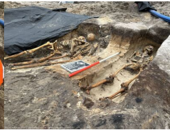
Podsumowanie prac BPil 2023 r.