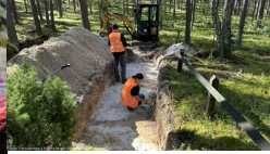
Podsumowanie prac BPil 2023 r.