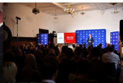
Podsumowanie prac BPil 2023 r.