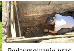
Podsumowanie prac BPil 2023 r.