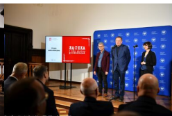
Podsumowanie prac BPil 2023 r.