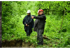
Podsumowanie prac BPil 2023 r.