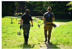
Podsumowanie prac BPil 2023 r.