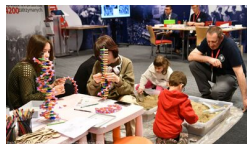
Podsumowanie prac BPil 2023 r.