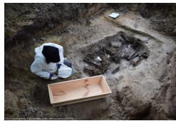
Podsumowanie prac BPil 2023 r.