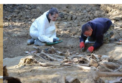
Podsumowanie prac BPil 2023 r.