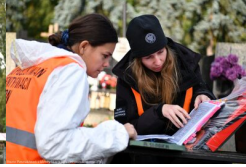
Podsumowanie prac BPil 2023 r.