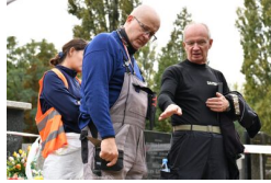
Podsumowanie prac BPil 2023 r.