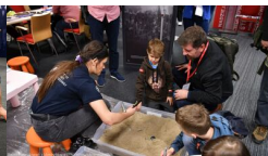
Podsumowanie prac BPil 2023 r.