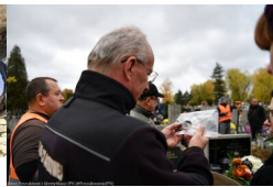
Podsumowanie prac BPil 2023 r.