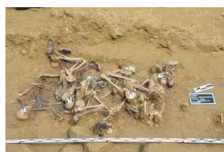
Podsumowanie prac BPil 2023 r.