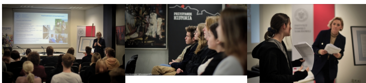
PL Katowice 2023 spotk 3