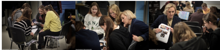
PŁ Katowice 2023 spotk 3 (11)