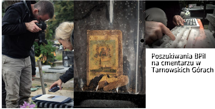
Poszukiwania BPil na cmentarzu w Tarnowskich Górach