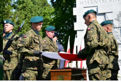
Uroczystości pogrzebowe Ireny Odrzywołek w Krakowie