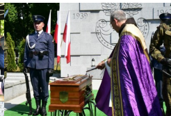
Uroczystości pogrzebowe Ireny Odrzywołek w Krakowie