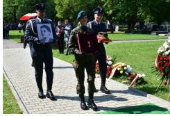
Uroczystości pogrzebowe Ireny Odrzywołek w Krakowie